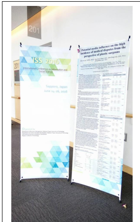
會議現場旗幟與海報