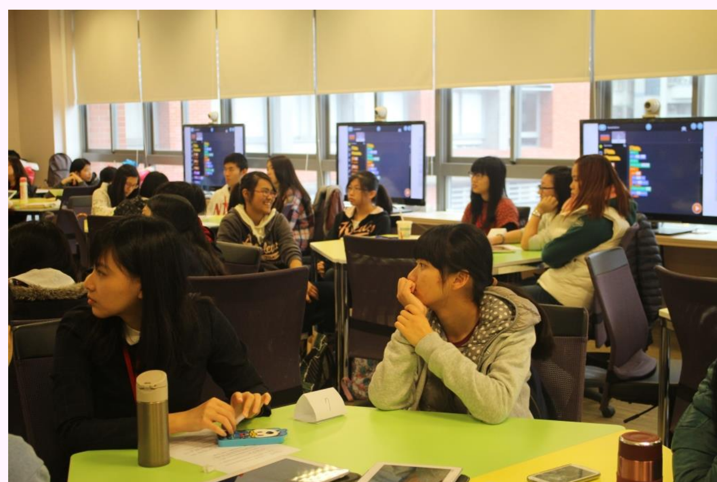
科技感十足的國北未來教室