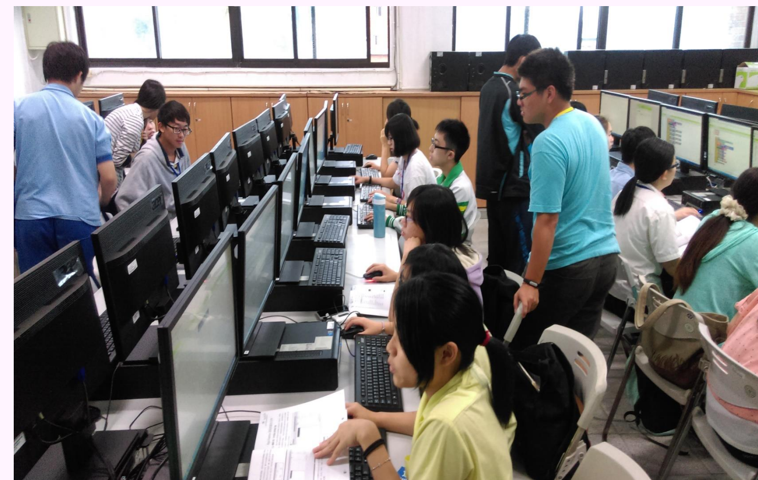
趣味APP程式設計教學