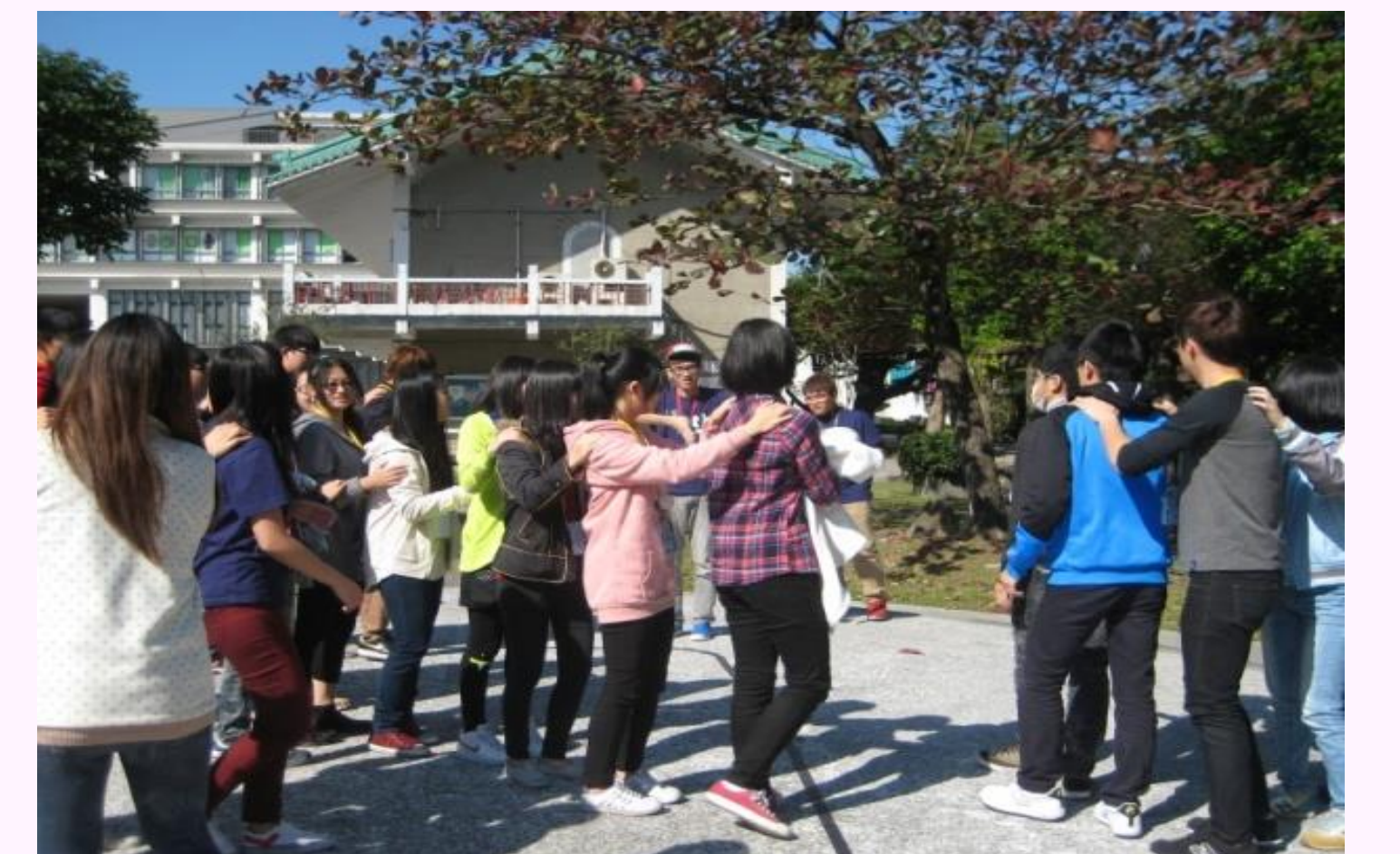
嗨翻天的科學營大地遊戲

科學營第2梯@國北教大：37位(女24位、男13位)學員參加，數理興趣與自信顯著提升