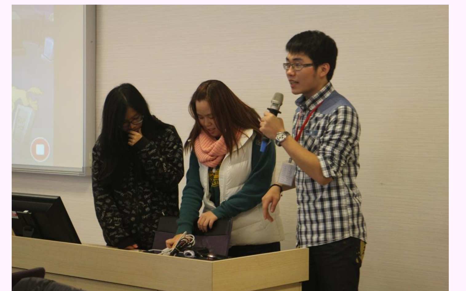
學員上台發表自己寫的APP遊戲