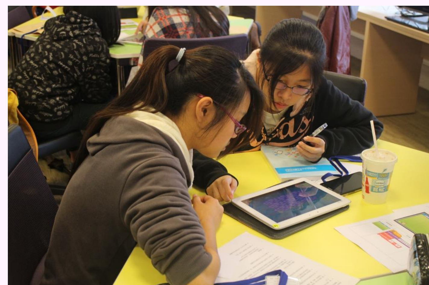
開發趣味的貓狗大戰APP遊戲