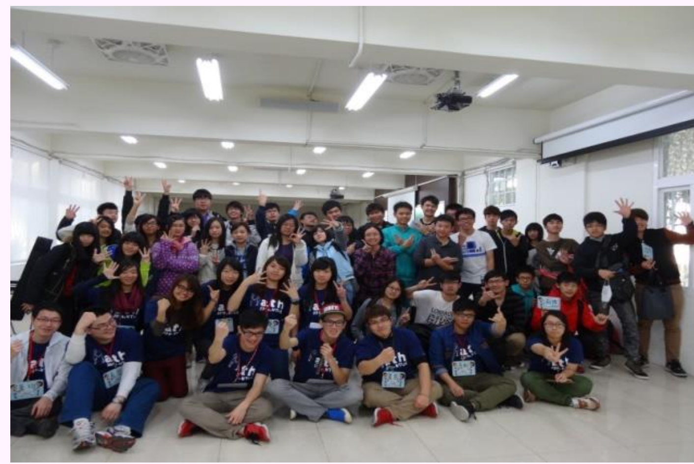
所有學員與輔導員大合照

科學營第1梯@陽明高中：53位(女34位、男19位)學員參加，滿意度高於4者達92%