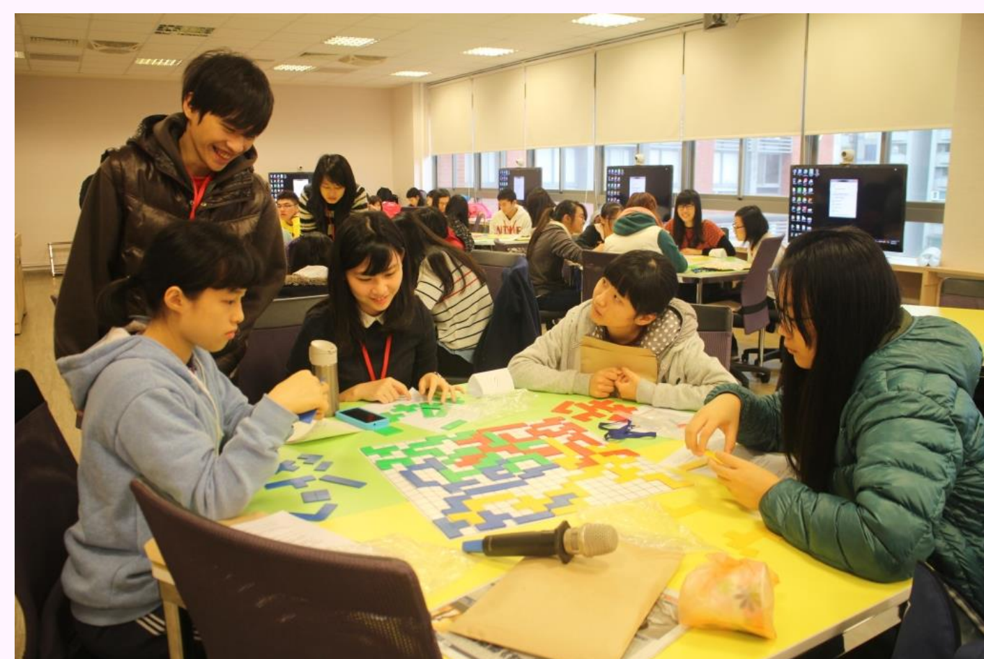
有趣的數學幾何桌遊

科學營第2梯@國北教大：37位(女24位、男13位)學員參加，數理興趣與自信顯著提升