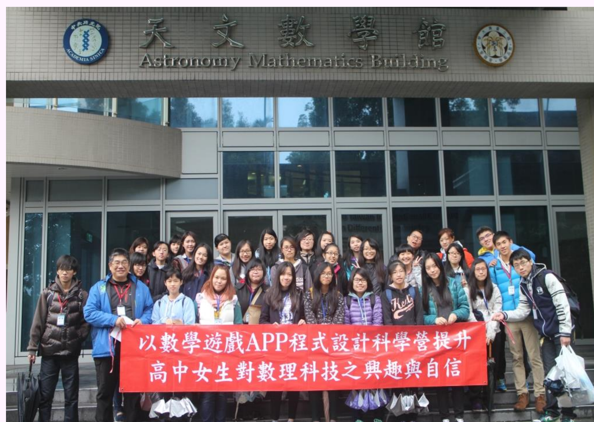
中研院天文物理所前大合照