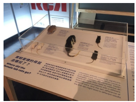
圖三、展場中的實驗區模型展示