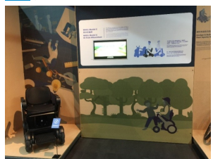
圖四、展場中的WHILL Model C高科技輪椅