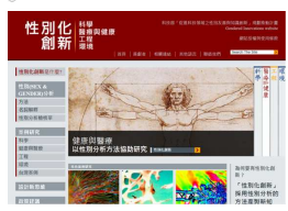
圖一、性別化創新中文網